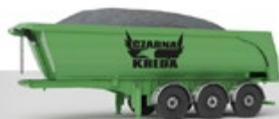
Czarna Kredo sypka