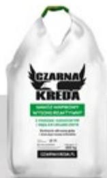
Czarna Kredo granulowana