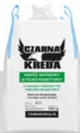
Czarna Kredo sypka mielona